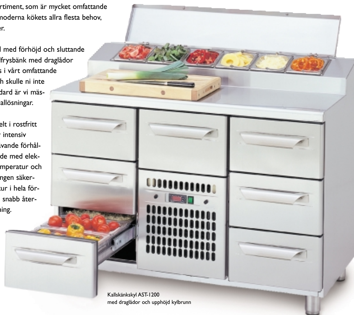
Kallskänkskyl AST-1200 med draglådor och upphöjd kylbrunn

Alla våra bänkar är helt i rostfritt och konstruerade för intensiv användning under krävande förhål-landen. De är utrustade med elek-tronisk styrning av temperatur och avfrostning. Fläktkyllningen säker-ställer jämn temperatur i hela för-varingsutrymmet och snabb åter-hämtning efter inlastning.