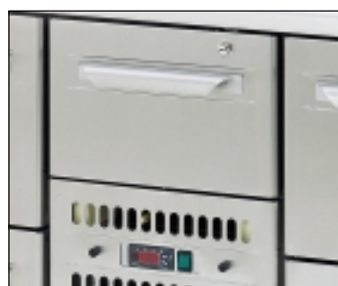
På flertalet modeller kan draglåda erbjudas ovan maskinenheten (se specifikation på omstående sida).