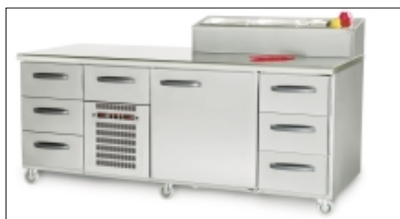
Exempel på specialprodukt: Kombinerad kyl- och frysbank med upphöjd och snedställd brunn för 3 x GN 1/3 - 100.

Vår bänkserie omfattar även värmeskåp, värmerier och neutrala enheter.